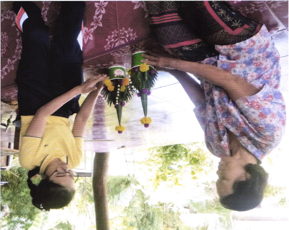
ស្ត្រីប្រចានគ្រូស្នាក់នៅស្ថានីយ៍ប្រឹក្សា